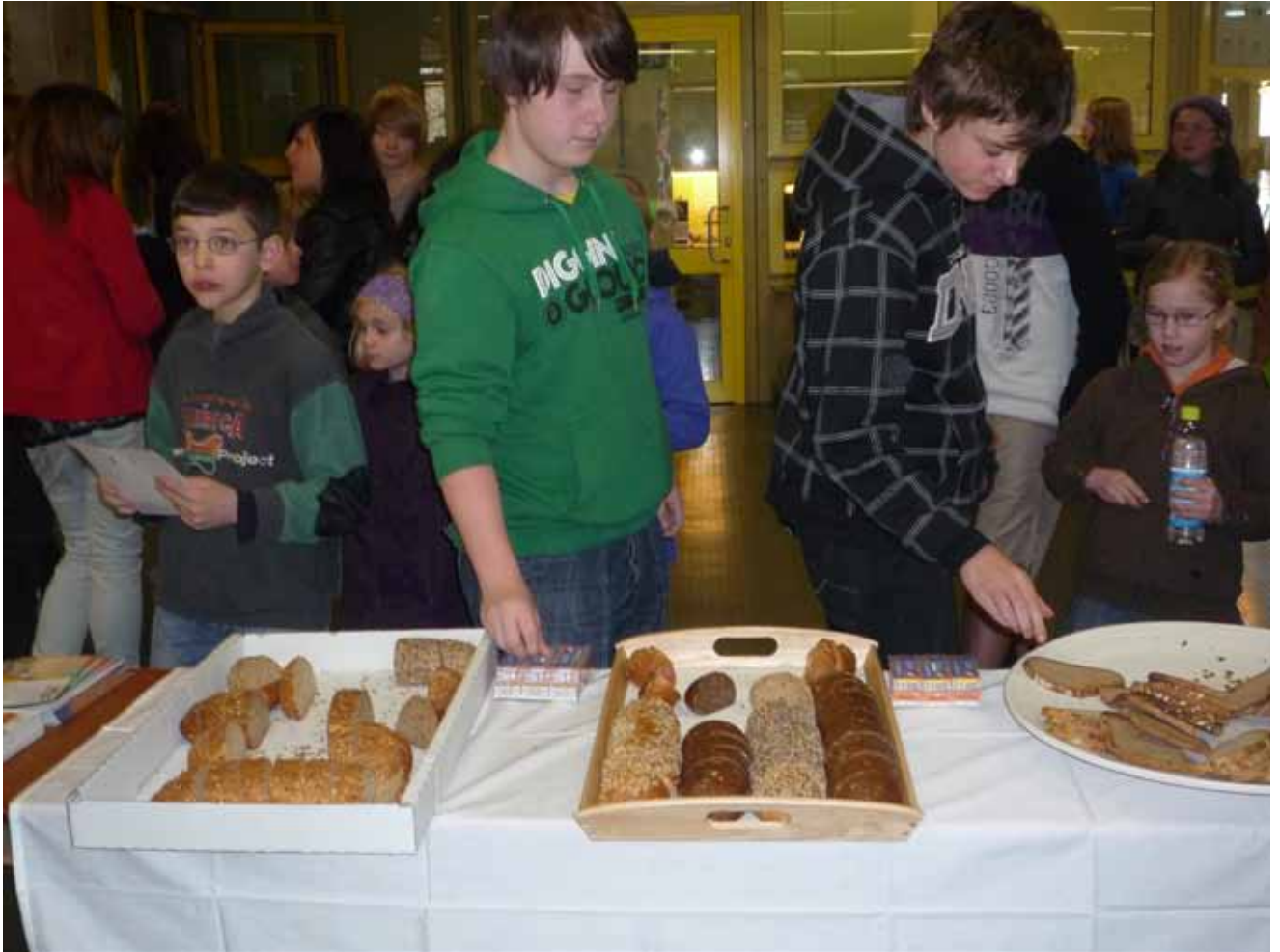
Bei dieser Vielzahl an Sorten fällt die Wahl schwer.