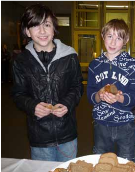
Wer hätte gedacht, dass trocken Brot so duftet.

Trockenes Brot und Wasser gab es zum Abschluss einer Fastenaktion an der Schule Zusmarshausen. Die Schülerinnen und Schüler griffen aber gerne zu.